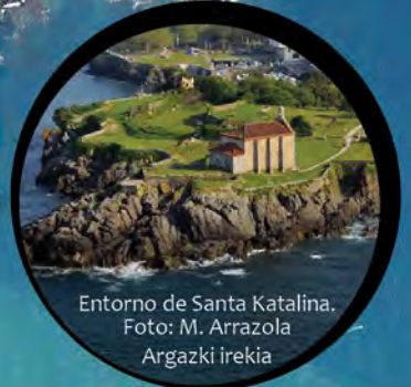
Entorno de Santa Katalina. Foto: M. Arrazola Argazki irekia