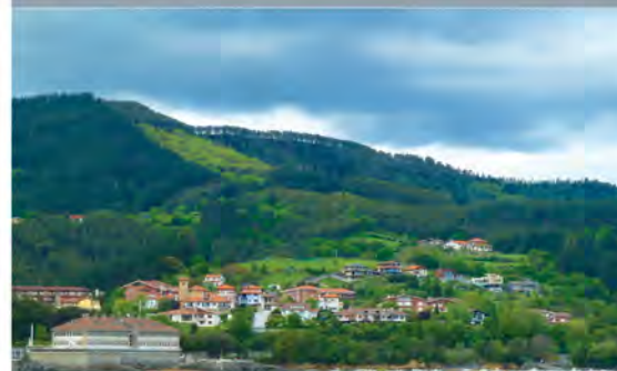
Sukarrieta y cordal de Katillotxu