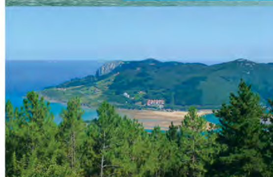
Vistas desde Katillotxu