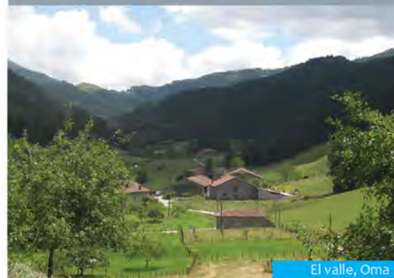
El valle, Oma