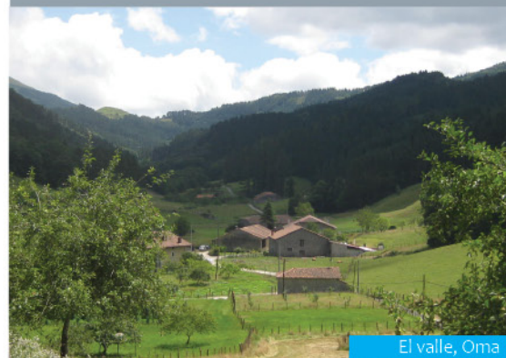
El valle, Oma