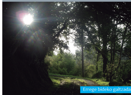
Errege bideko galtza