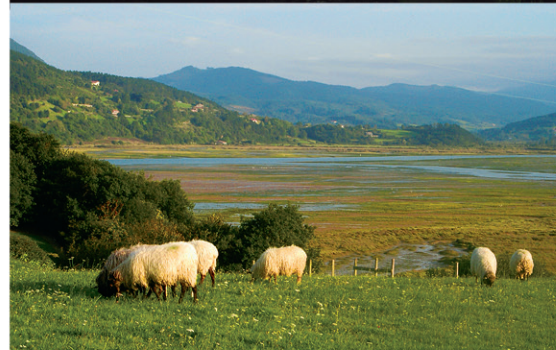
Busturiako landazabala eta padura